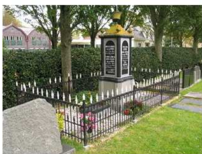
29.21 t.m 26 fam Van de Worm