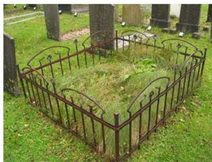
14.11 en 12 hekwerk