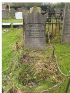
20.08 Foppe Coerkamp