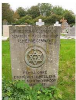
41.06 Fenna Orré