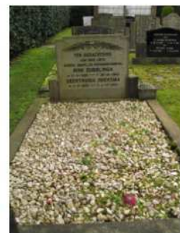
51.02 Rink Dubblinga