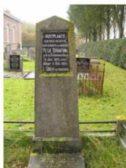
26.04 en 05 Schaafsma-Griik