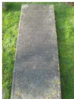
46.16 Tjintje Wielema