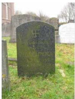
18.11 Neeltje Fenenga