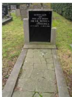
15.03 Pietje Dubblinga