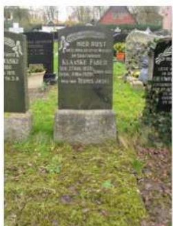
40.10 Klaas Faber