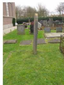
14.14 Trijnte Dubblinga en Jouke C. Visser