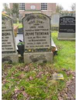
26.23 Jeppe Teensma