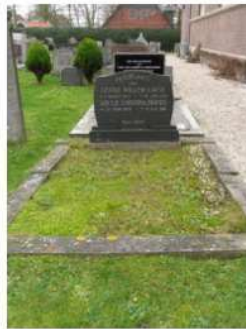
44.19 Gerrit Willem Carst