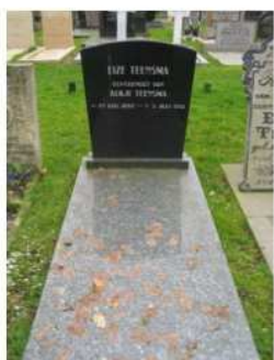
41.07 Eize Teensma