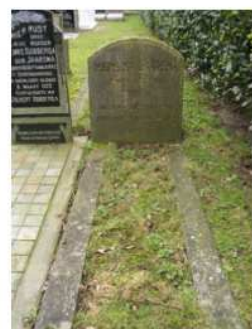
27.01 Meinsina Jaarsma