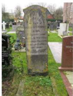
40.12 Klaas Leendert Faber