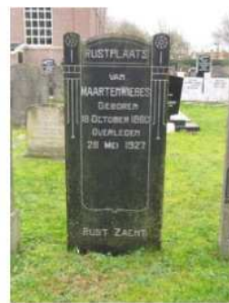
24.16 Maarten Wiebes