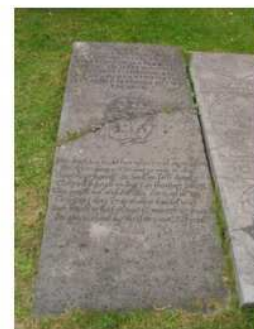
Hist hoek 4