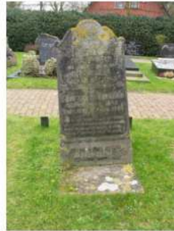
53.15 D.T. Visser