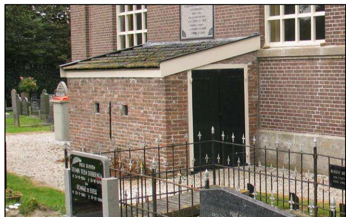
Afb. 2. Het lijkenhuisje uit 1875 achter de kerk.