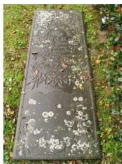
24.01 Aukje de Boer-Karst