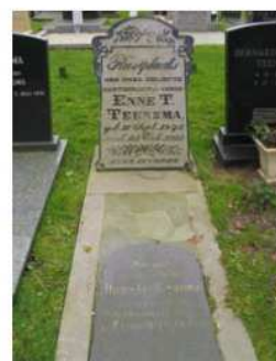
41.08 Enne T. Teensma