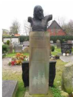
48.11 J.W.F. Warners