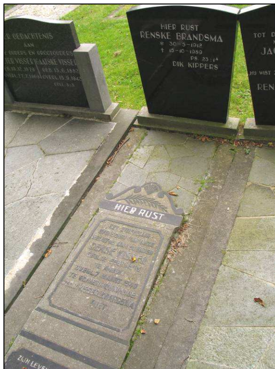
Afb. 7. Oud grafmonument bij een nieuwer graf.

De huidige urnenmuur dient vervangen te worden. Dat heeft te maken met het feit dat de huidige muur al bijna dertig jaar oud is en bovendien er slecht uitziet. De eisen die destijds aan een dergelijk object werden gesteld waren anders dan vandaag de dag. In de werkgroep is ondermeer