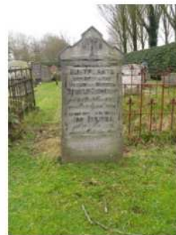
20.05 en 06 Jan Zeilinga en Stijntje Coerkamp