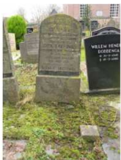
31.20 Rink Dobbenga