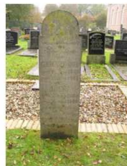
31.11 Grietje Dol