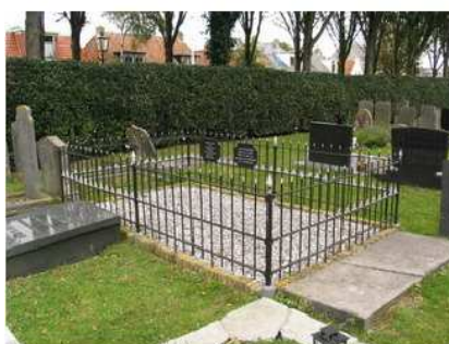
08.07 en 08.08