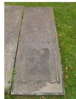
Hist hoek 1