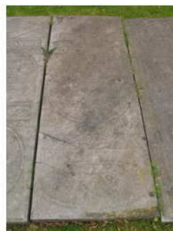
Hist hoek 3