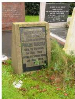
55.04 Paulus Dijkstra