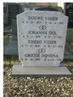
32.09 Douwe Visser