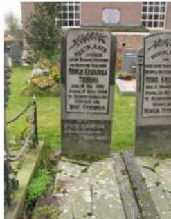
21.26 Reintje Kruisinga-Teensma