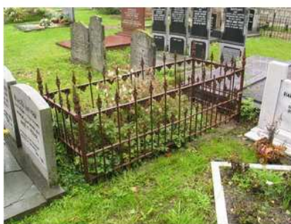
20.15 Geert Carst