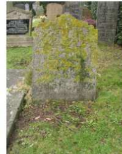
09.02 Engelina Zeilinga