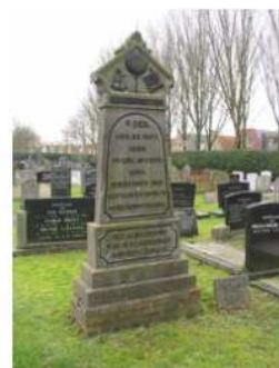
27.17 Willem Dijk