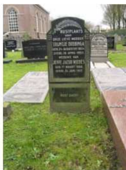
27.10 Trijntje Dobbinga