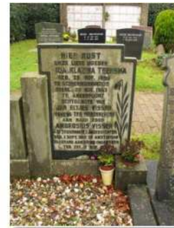
53.03 Ida Klazina Teensma