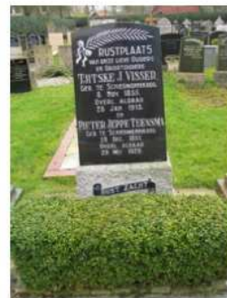
38.07 Pieter Jeppe Teensma