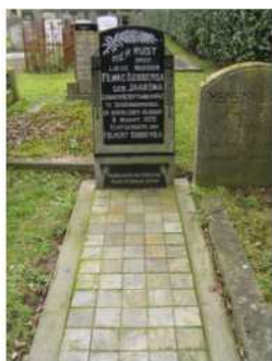
27.02 Fernke Jaarsma