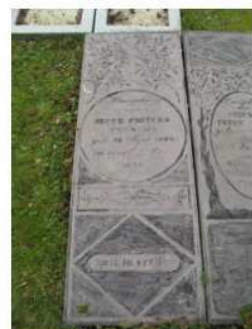
26.09 Jeppe Pieters Teensma