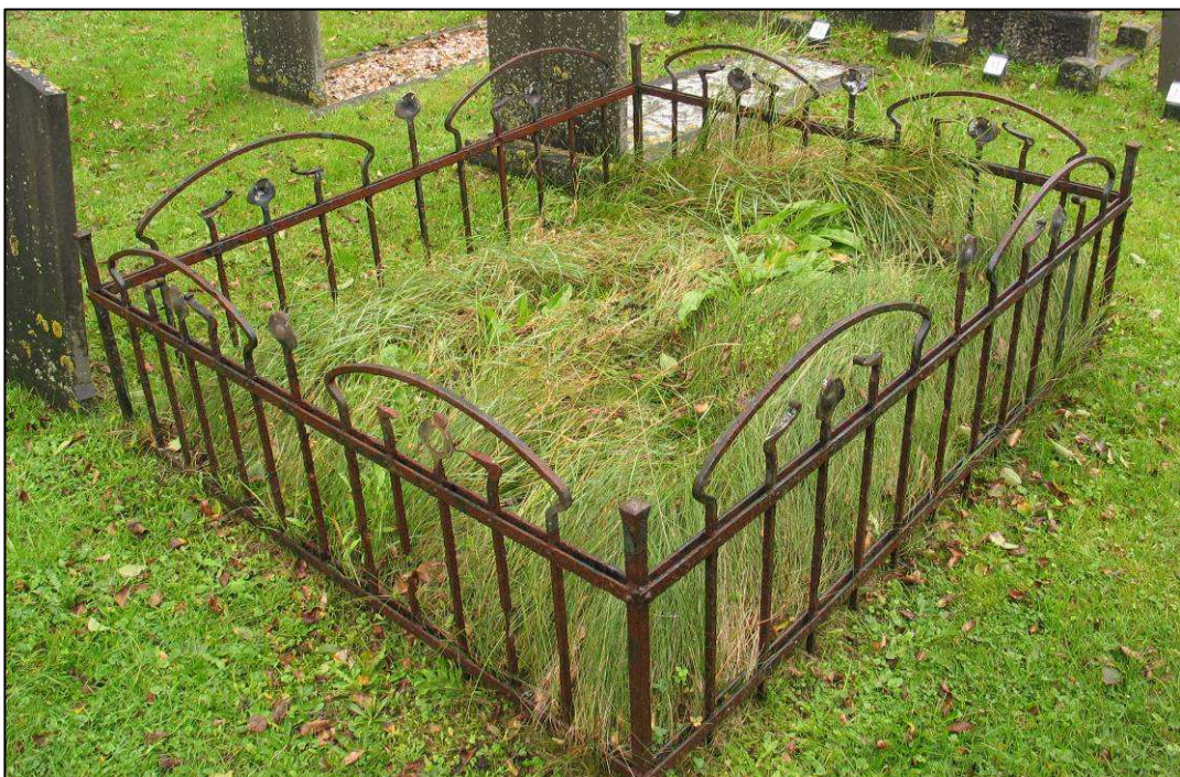
Afb. 6. Er resteren nog een aantal fraaie hekwerken op de begraafplaats.

Sommige details op de begraafplaats zullen de bezoeker verbazen. Zo zijn er twee graftekens met een swastika, maar ook is er een ruime variatie aan hekwerken. Aan die