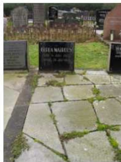
12.10 Gerda Matroos