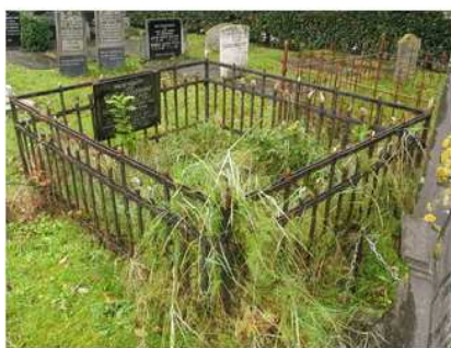
19.7 en 8 Reintje Teensma