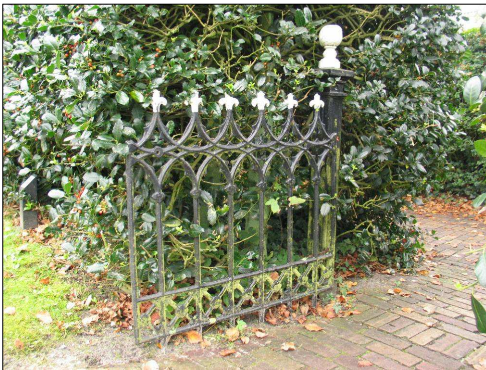
Afb. 3. Een van de hekken die eind 19de eeuw werden geplaatst.

begraafplaats buiten de kom van het dorp kwam er niet, maar wel nieuwe ijzeren hekken voor de bestaande begraafplaats in plaats van de bestaande houten. 8