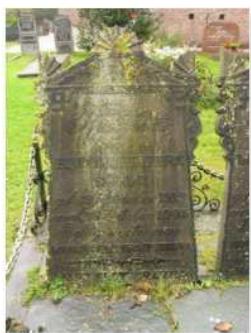
21.28 Reintje Colle