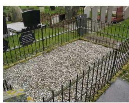
08.06 H.W. Hundlingius