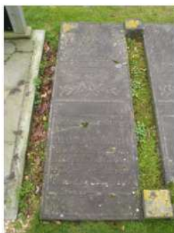
48.09 C.G.M. Quack