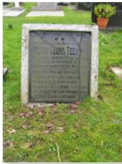
41.10 Pieter T. Teensma