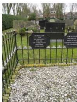
08.05 F.T. Hundlingius