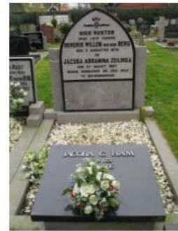
45.11 H.W. v.d. Berg