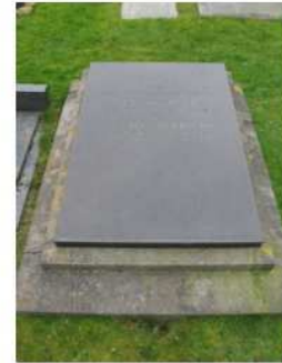
54.16 Klaas Visser