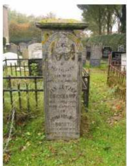
20.07 Jacoba Borst