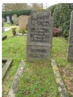
08.02 Teunis Zeilinga