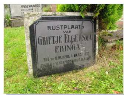
46.18 Grietje Eeringa