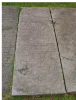
Hist hoek 2