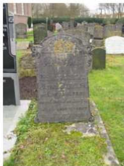
19.12 Haaike de Boer