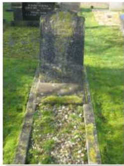
51.04 Ambrosius Dubblinga