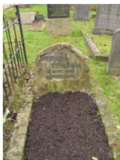
18.13 Wopke Fenenga