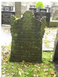
30.17 Grietje Teensma