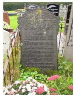
10.12 Antje E. Buwalda