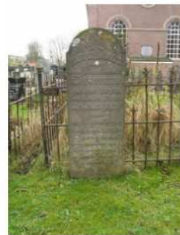
25.30 M.J. Tunteler