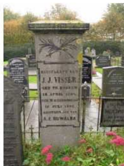
10.11 J.J. Visser