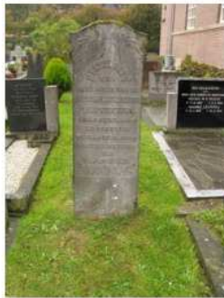
44.18 Renske Witteveen