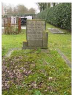
26.02 en 26.03 Leendert Faber en Trijntje Griik