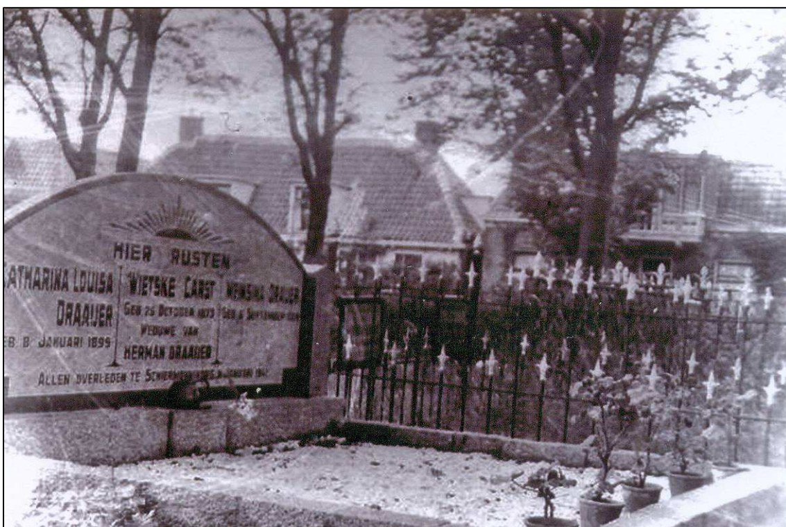
Afb. 4. Graf familie Draaijer, slachtoffer van bombardement van 8 januari 1941.