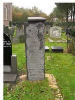
20.10 Jeanette Coerkamp