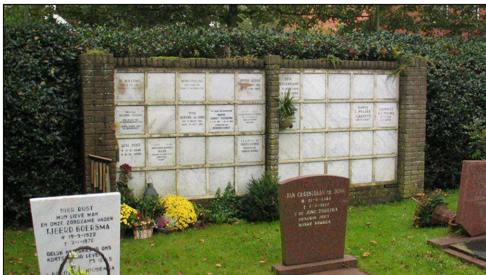
Afb. 8. De huidige urnenmuur.

gesproken over de locatie en de uitwerking van een nieuw ontwerp. Qua locatie is ondermeer gesproken over de achterzijde van de kerk. Gezien echter het feit dat de huidige plek reeds jaren als zodanig in gebruik is, lijkt het beter deze te handhaven.