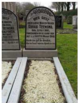
25.09 Ruurd Teensma