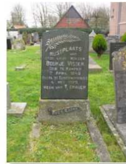
44.15 Boukje Visser