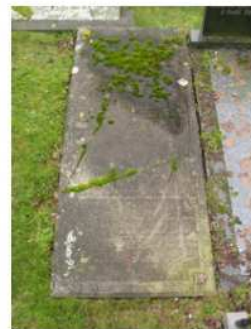
28.26 Janke Wiersma