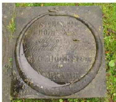
13.15 Steintje Hoeksma