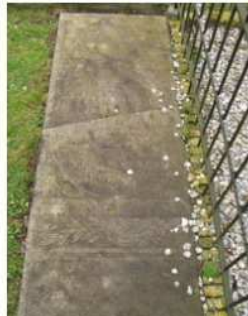
08.09 E.A. Borst-Zeilinga