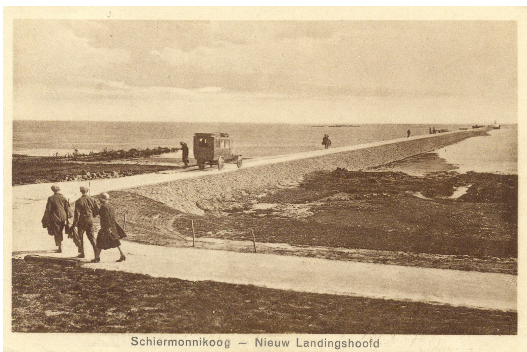
De nieuwe veerдам