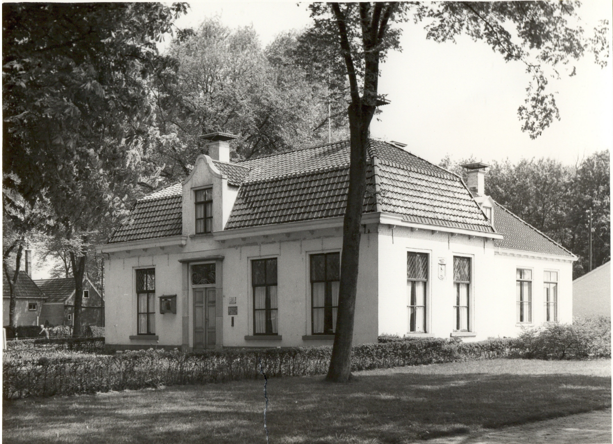
gemeentehuis van Schiermonnikoog

In ieder geval is zeker dat de archieven sinds 1855 in het dan gebouwde gemeentehuis hebben berust. Uit het bestek (inv.nr. 791) blijkt dat in de secretarie boekenkasten gemaakt moesten worden. Deze zullen ongetwijfeld ook gebruikt zijn voor de bewaring van het archief. Naderhand is het oud-archief geplaatst op de zolder van het gemeentehuis om vervolgens in