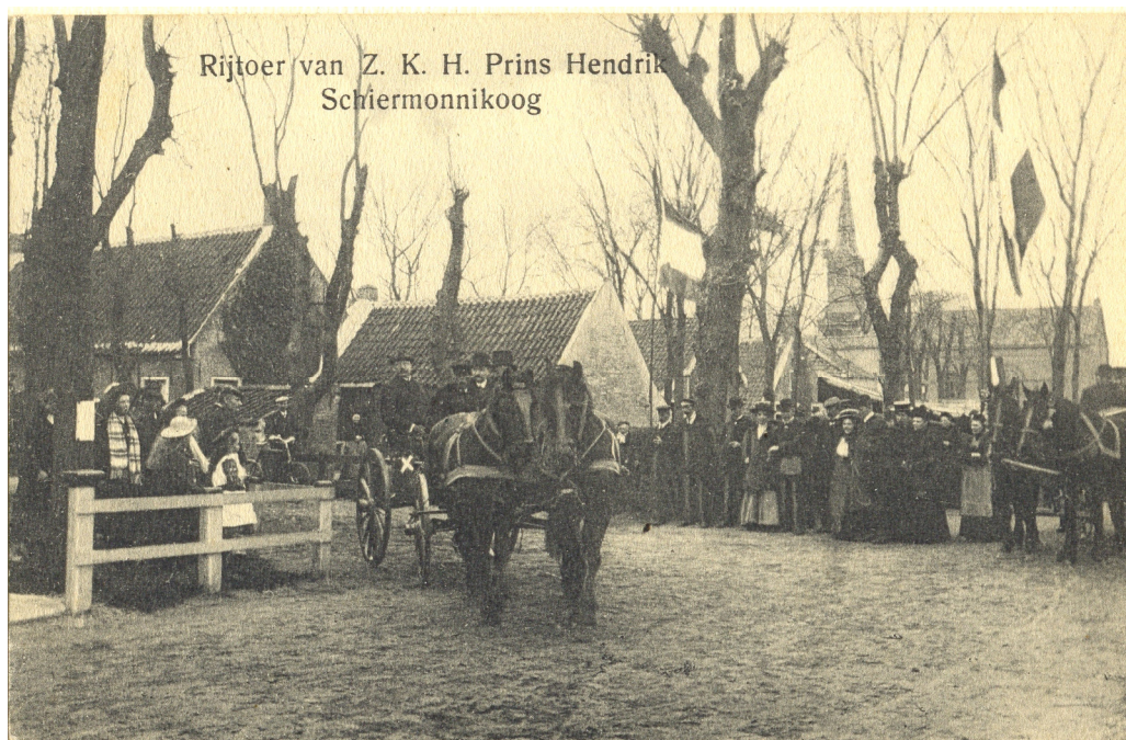
Prins Hendrik op bezoek in 1911