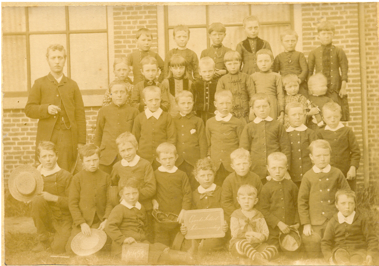
Klassefoto met links Gasau