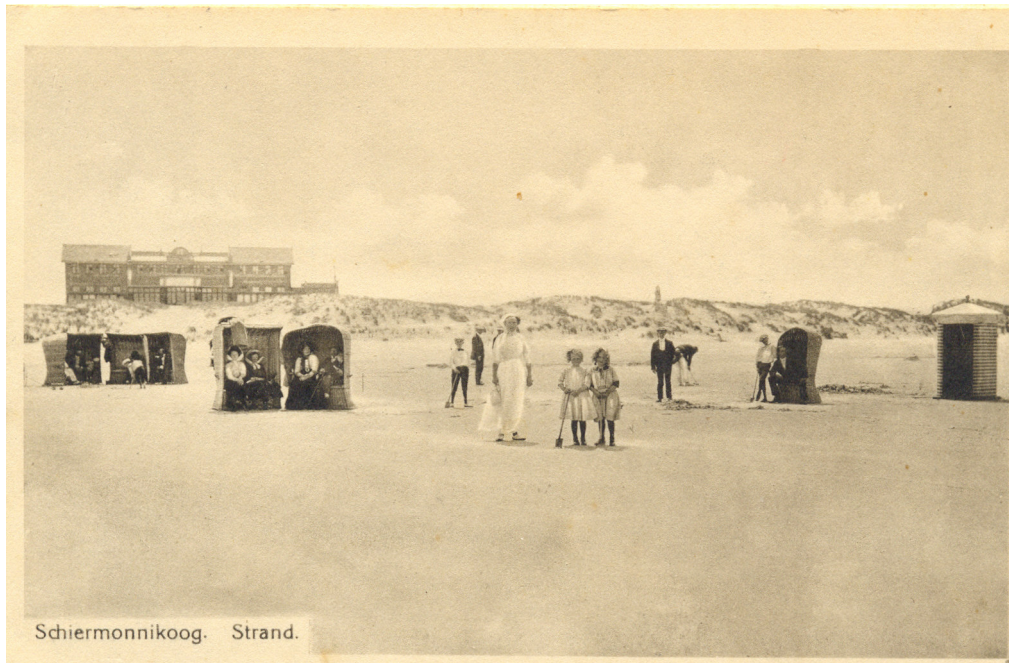
Beeld van het strandleven met op de achtergrond het Badhotel